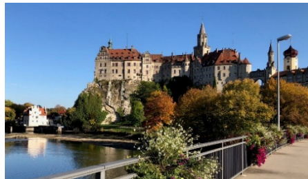
Schloss Sigmaringen, Verwaltungssitz der Fürsten von Hohenzollern-Sigmaringen